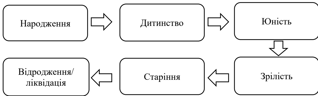
Рисунок 1 – Класична модель життєвого циклу організації

Для повного аналізу спочатку слід розглянути класичну модель життєвого циклу організації (Рис. 1) [2].