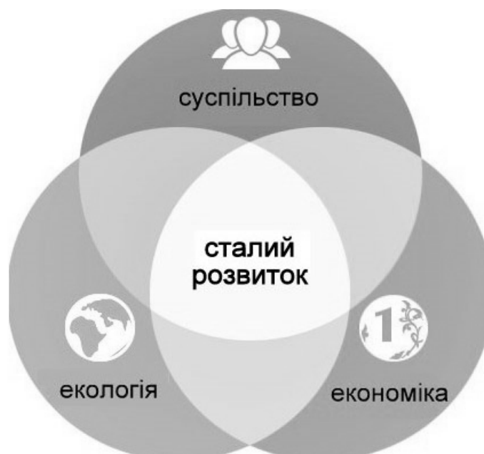
Рисунок 1 – Основні складові елементи концепції сталого розвитку у глобальному трактуванні [2]

У 2015 році відбувся Саміт зі сталого розвитку і була видана резолюція Генеральної Асамблеї Організації Об'єднаних Націй від 25 вересня 2015 року № 70/1, де було схвалено план дій на період дій після 2015 року. Згідно з програмним документом було виділено 17 цілей і 169 задач. Цілі і завдання, які були затвердженні мають комплексний характер і збалансовують складові концепції сталого розвитку: економічну, екологічну і соціальну (рис. 1).