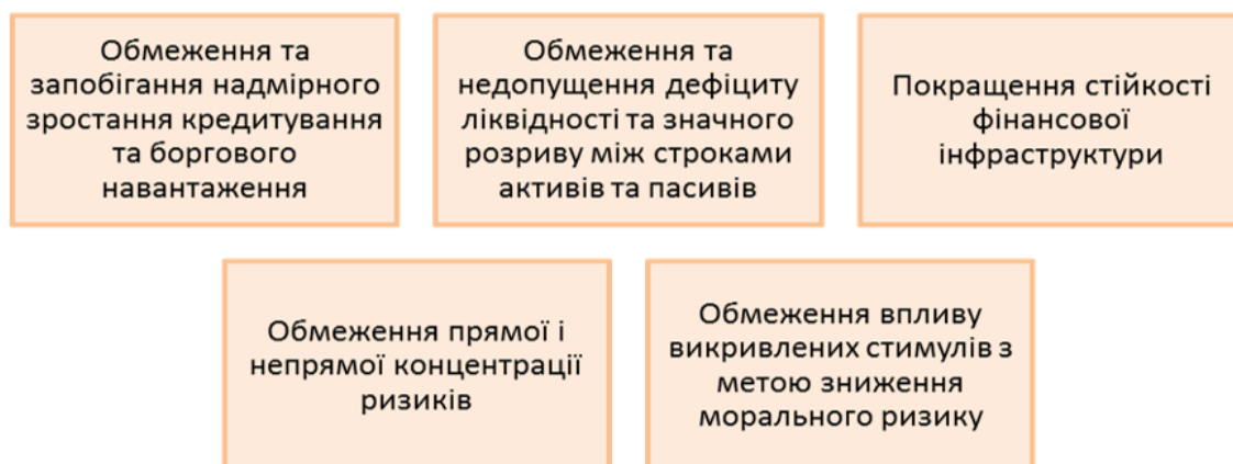
Рисунок 1 – Цілі макропруденційної політики [2]

Основним провідником макропруденційної політики в Україні, як і в більшості країн, виступає центральний банк. Одна з фундаментальних цілей багатьох центральних банків світу – сприяння фінансовій стабільності, що є передумовою стабільного економічного зростання. Відповідно до рекомендацій ESRB стратегічні цілі макропруденційної політики досягаються через ряд проміжних цілей (Рис.1):