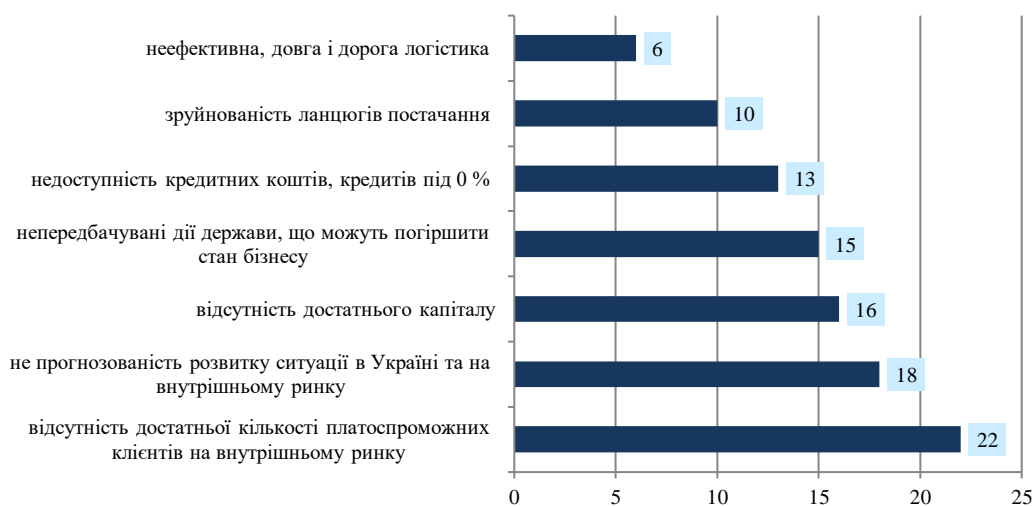
Рисунок 3. Основні перешкоди у розвитку бізнесу у 2023 році, %