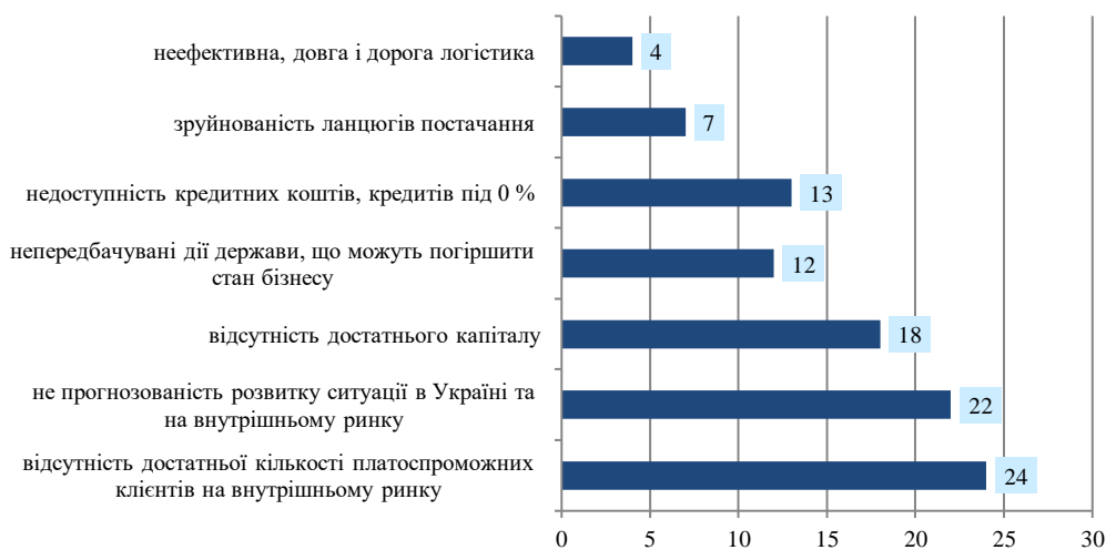
Рисунок 2. Основні перешкоди у розвитку бізнесу у 2022 році, %