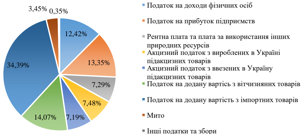
Рисунок 1. Склад та структура податкових надходжень до Державного бюджету України за 2021 рік