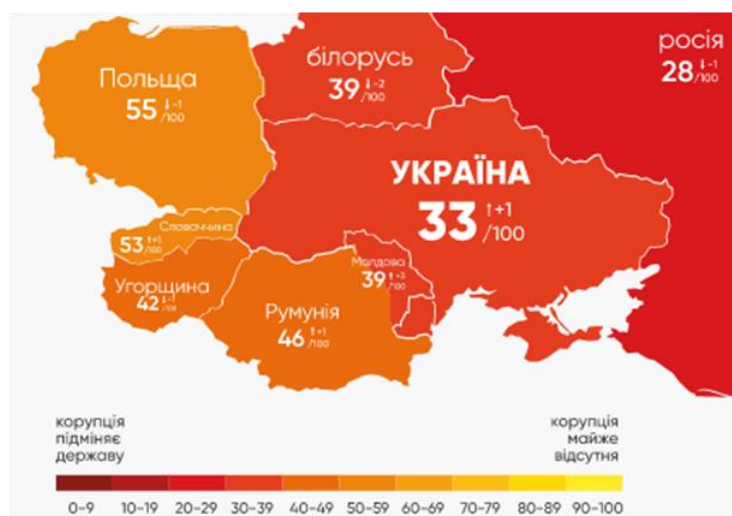
Рисунок 4. Рейтинг балів в Індексі сприйняття корупції за 2022 рік