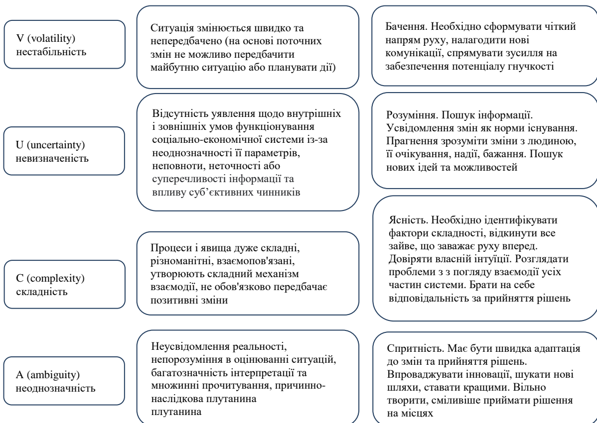
Рисунок 2. Компоненти VUCA-світу та види реакції на них в бізнес-середовищі

Проблема невизначеності у розвитку соціально-економічних систем будь-яких рівнів полягає ще в тому, що їм, як правило, не притаманні такі характеристики як повторюваність та регулярність, що зумовлює їх неергодичність (непередбачуваність історичних процесів). Отже, економісти й управлінці змушені вести пошук «все більш та більш абстрактних аналогових моделей», як зазначав Р. Лукас. Невизначеність потребує розуміння – розуміння того, що стрімкі зміни перетворилися на норму функціонування бізнесу. Це вимагає необхідності усвідомлювати очікування, сподівання, бажання і страхи організації й вміння вести постійний пошук нових ідей та можливостей. Реакція на компоненти VUCA-світу має бути відповідною (рис. 2).