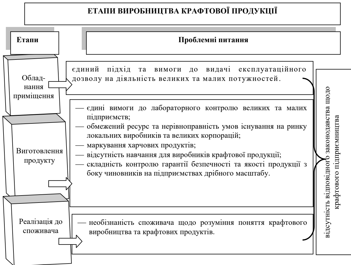
Рисунок 1. Етапи та проблеми виробництва крафтової продукції в Україні

Визначені на рис. 1 проблеми потребують використання системного і комплексного підходу, а саме розроблення і виконання відповідних заходів, що створять умови для відродження та розвитку крафтового виробництва, розкриття соціально-економічного, культурного потенціалу сектору крафтової економіки та забезпечать її подальший сталий розвиток.