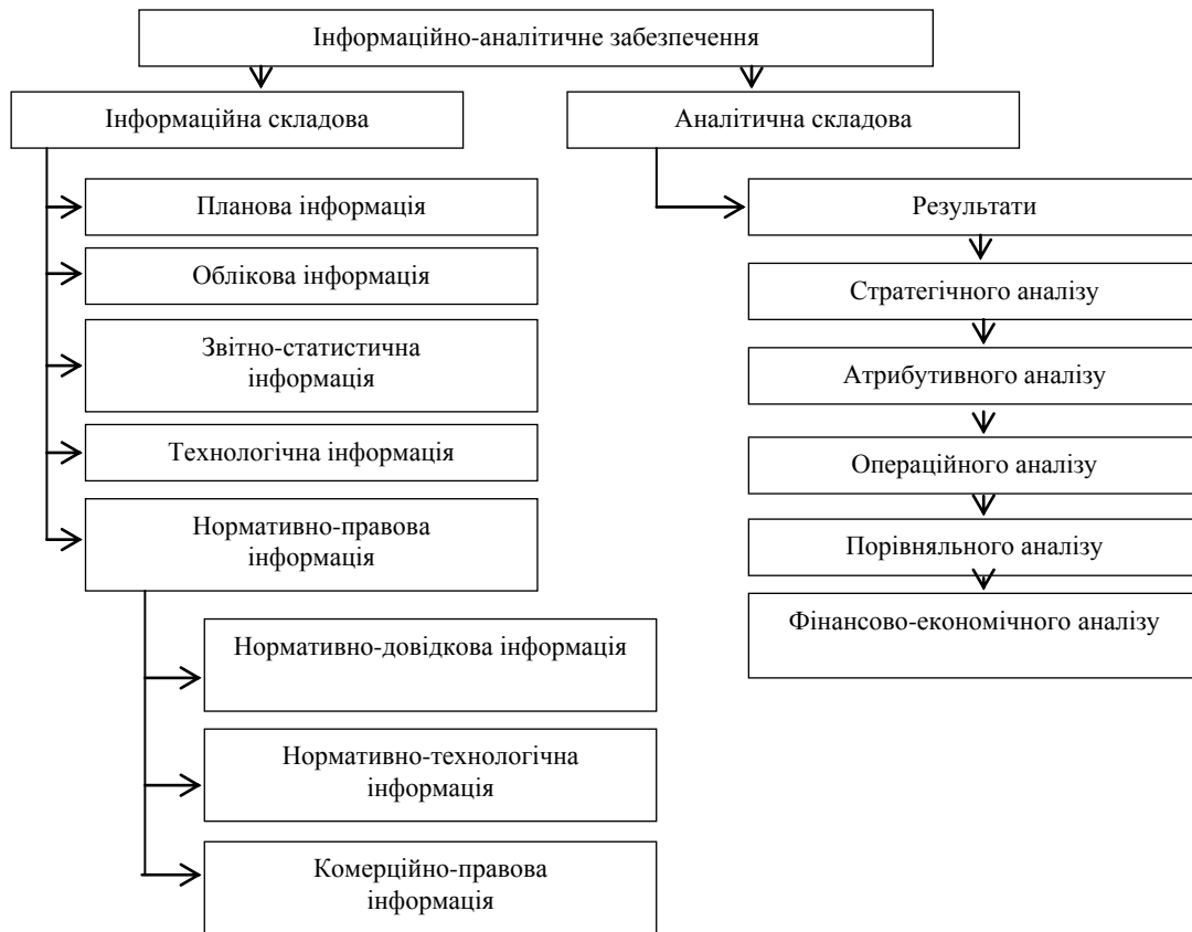
Рисунок 2. Система інформаційно-аналітичного забезпечення підприємства

стратегічне ціноутворення, аналіз життєвого циклу, аналіз ланцюжка цінностей, побудова карт бізнес-процесів, ABC-аналіз, XYZ-аналіз, SWOT-аналіз та функціонально-вартісний аналіз (ФВА).