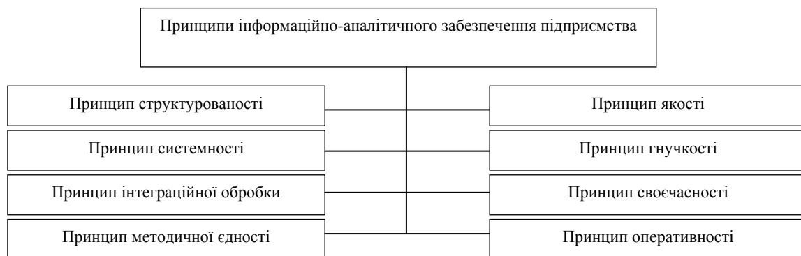
Рисунок 1. Принципи інформаційно-аналітичного забезпечення

Основні принципи інформаційно-аналітичного забезпечення підприємства відображені на рис.1.