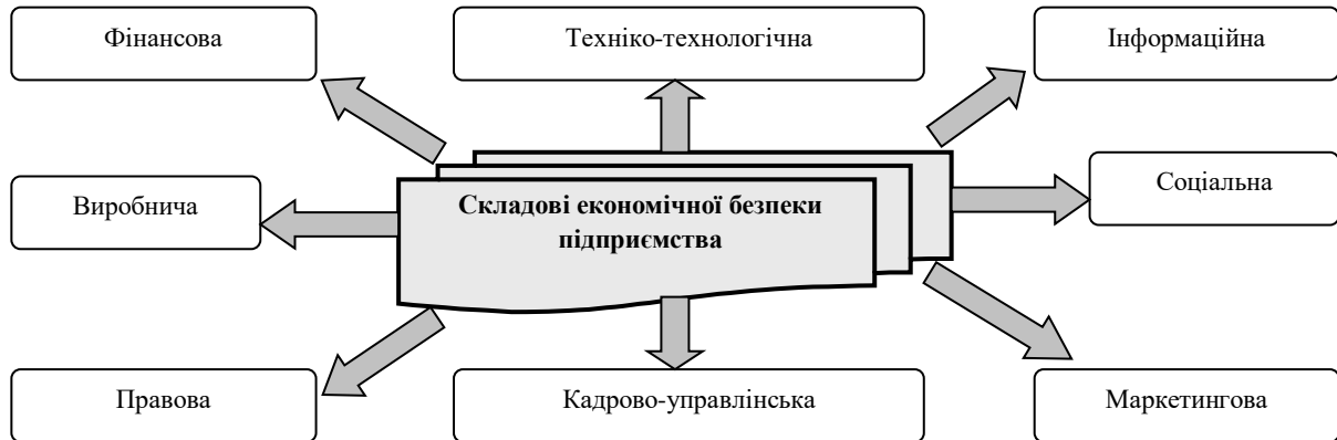
Рис. 2. Складові економічної безпеки промислового підприємства

забезпечення економічної безпеки кожного підприємства формується індивідуально, його складові та важелі управління залежать від багатьох чинників, серед яких частіше всього дослідники виокремлюють найбільш важливі складові, перелік яких показано на рис. 2.