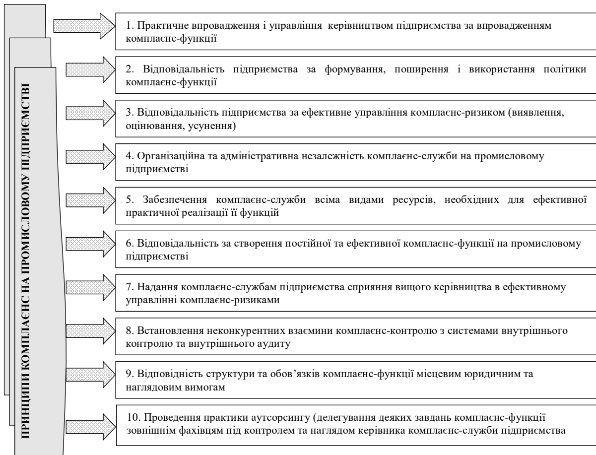
Рис. 2. Принципи комплаєнс-функції на промисловому підприємстві

системи внутрішнього контролю, яка адекватно оцінює і управляє комплаєнс-ризиками, з якими стикається в своїй діяльності промислове підприємство. Згідно рекомендацій Базельського комітету [9] під комплаєнс-ризиком розуміють ризик застосування юридичних санкцій, застосування санкцій регулюючих органів, істотного фінансового збитку, втрати репутації підприємством в результаті недотримання ним законів, інструкцій, правил, стандартів саморегулювальних організацій або кодексів поведінки, які стосуються комерційно-виробничої діяльності. Комплаєнс-ризик іноді трактується як ризик чесності, або порядності, оскільки репутація підприємства тісно пов'язана з дотриманням ним принципів порядності і справедливості у своїй діяльності. Наявність комплаєнс-ризиків може призвести промислове підприємство до погіршення репутації, втрати довіри з боку регулюючих органів, інвесторів, партнерів, акціонерів, споживачів. Видами комплаєнс ризику є продуктовий ризик, регулятивний ризик, репутаційний ризик (рис. 2).