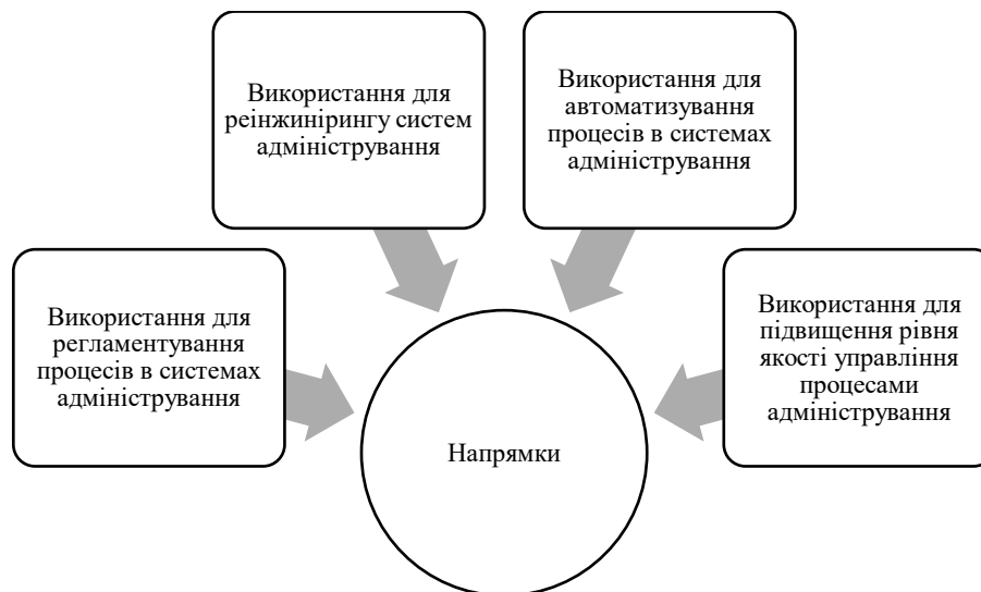
Рис. 1. Ключові напрямки використання результатів оцінювання рівня сформованості систем адміністрування в управлінні підприємствами

Оцінювання рівня сформованості систем адміністрування в управлінні підприємствами у стратегічній чи тактичній перспективах забезпечує можливість автоматизування відповідних процесів (наприклад, інформаційно-документаційних потоків, алгоритмів дій тощо) (рис. 1). При цьому, важливо розуміти усі процеси в таких системах, на високому рівні управляти ними, їх регламентувати, контролювати тощо. Як, зокрема, зауважують В.В. Кондратьєв та М.Н. Кузнецов [1], «побудова діаграм потоків даних відіграє роль вихідного технічного завдання для налаштування інформаційних систем управління, які і повинні підтримувати такі потоки даних з використанням програмних засобів».