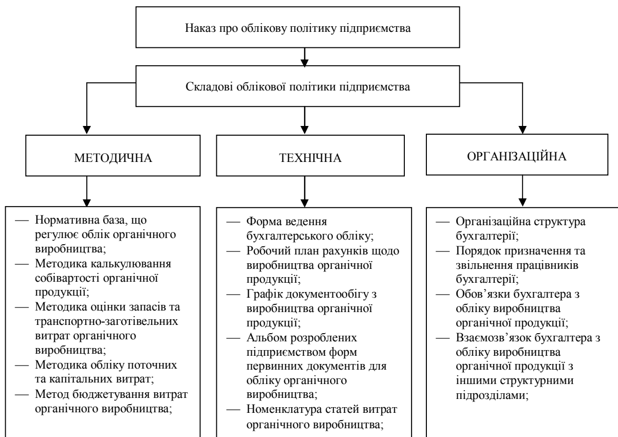
Рис. 2. Складові облікової політики для цілей організації обліку органічної продукції