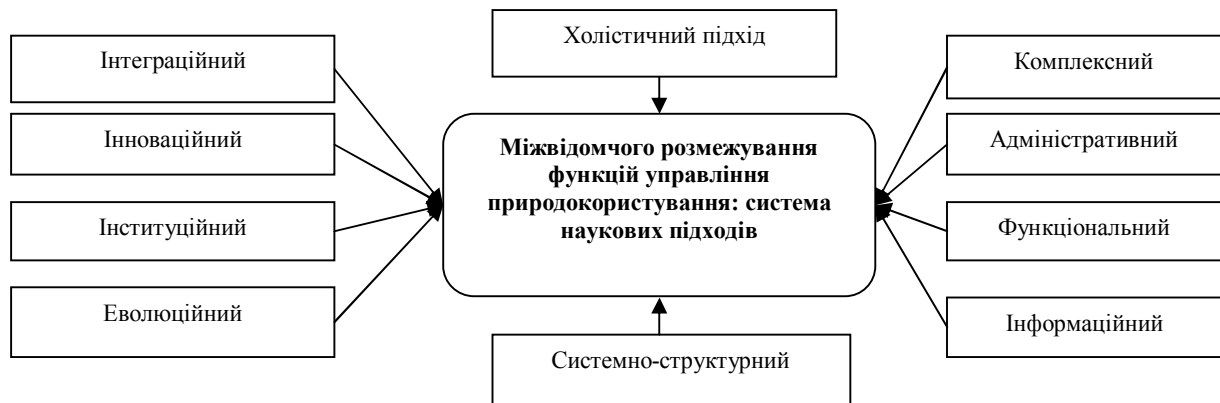
Рис. 2. Система наукових підходів для проведення міжвідомчого розмежування функцій управління природокористування (авторське бачення)

Вагоме місце серед наукових підходів до визначеної проблеми займають холистичний (цілісний), який інтегрує економічні, екологічні та нормативно-правові аспекти системи управління, теорію трансакційних витрат, а також системний та комплексні підходи. Водночас це нічим не знижує значення інших наукових підходів: інноваційного, інституціонального, еволюційного, структурно-функціонального, інтеграційного.