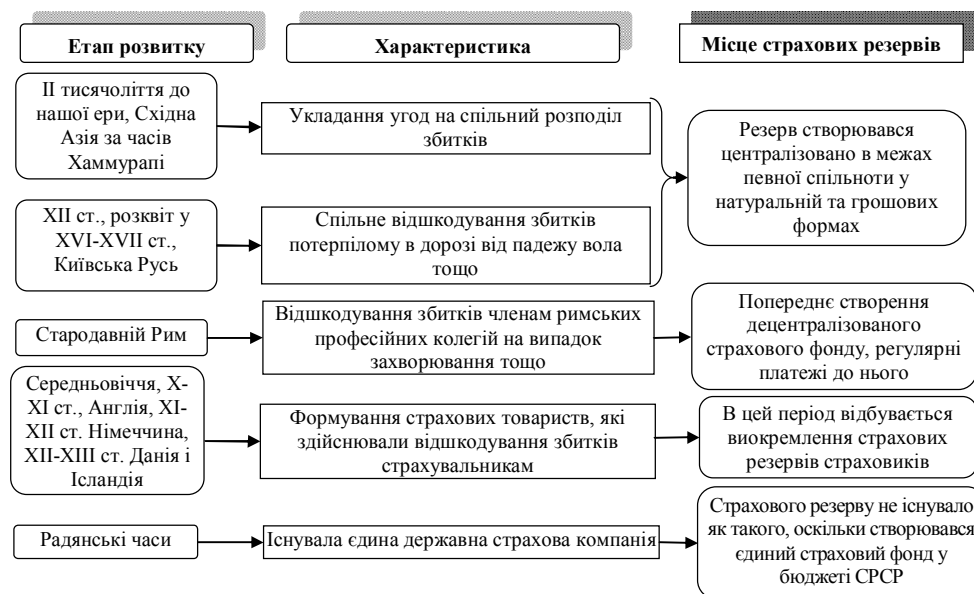
Рис. 1. Еволюція розвитку страхування та підходів до формування резервів страховика

розкрити зміст терміну «резерви» відповідно до специфіки своєї галузі знань, в процесі реалізації прикладних завдань бухгалтерського обліку, контролю, фінансового менеджменту та страхування.