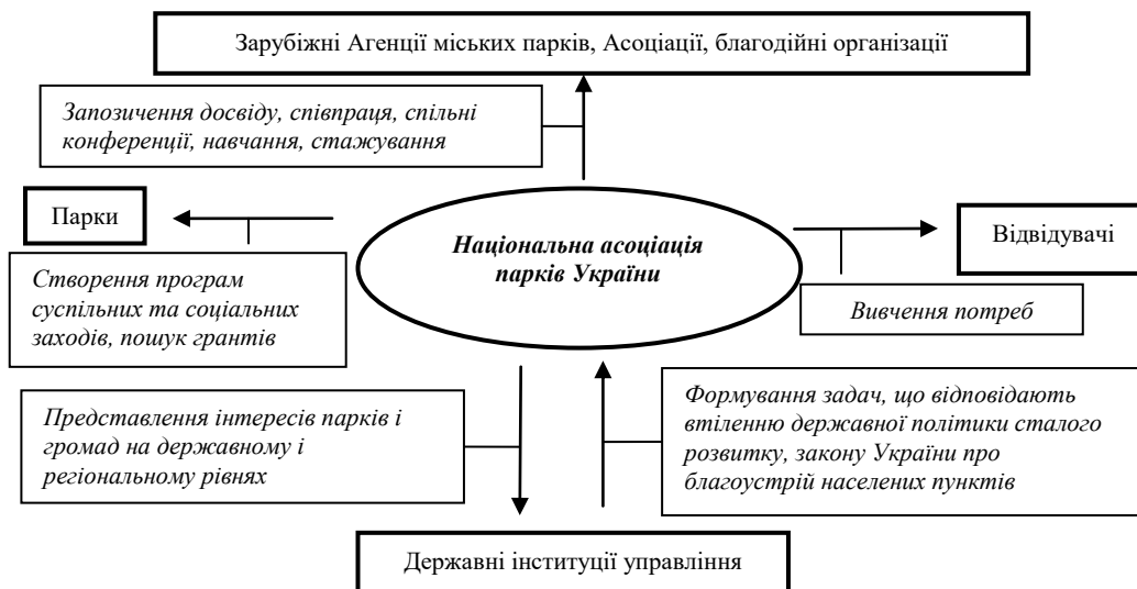
Рисунок 2. Формалізована модель функціонування Національної асоціації парків України

Створення Національної асоціації парків України дозволить винести на державний рівень актуальні питання озеленення місцевого рівня, які можуть перейти у регіональні тенденції щодо природокористування та організації громадських місць відпочинку. Наприклад створення коштовних приморських парків рекреаційного призначення неможливо втілити за кошти місцевих громад селищного типу, але в той же час економічні ефекти від даних парків отримає регіон в цілому. Основну ідею щодо місця Національної асоціації парків України в системі налагодження нових зв'язків між парками, державою та зарубіжними інституціями наведено на рисунку 2.