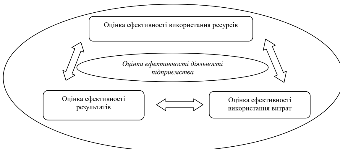
Рисунок 2. Оцінювання ефективності діяльності підприємства на основі системного підходу

Оцінка ефективності ресурсів підприємства включає оцінку ефективності використання основних фондів, оборотних активів, трудових та фінансових ресурсів.