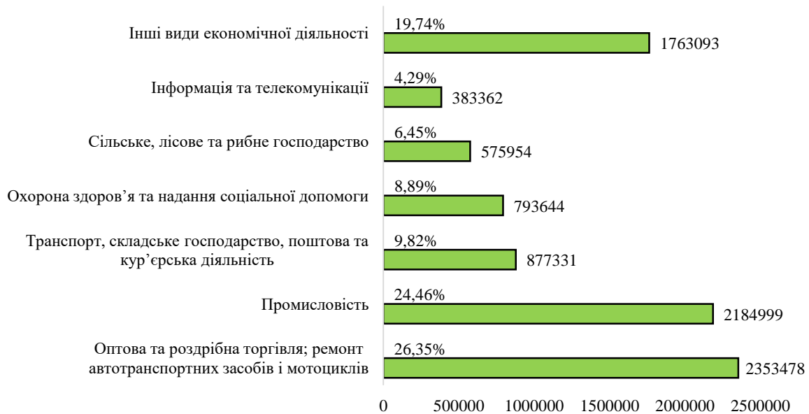
Рисунок 2. Кількість зайнятих працівників у підприємстві України у 2020 році за сферами економічної діяльності, осіб