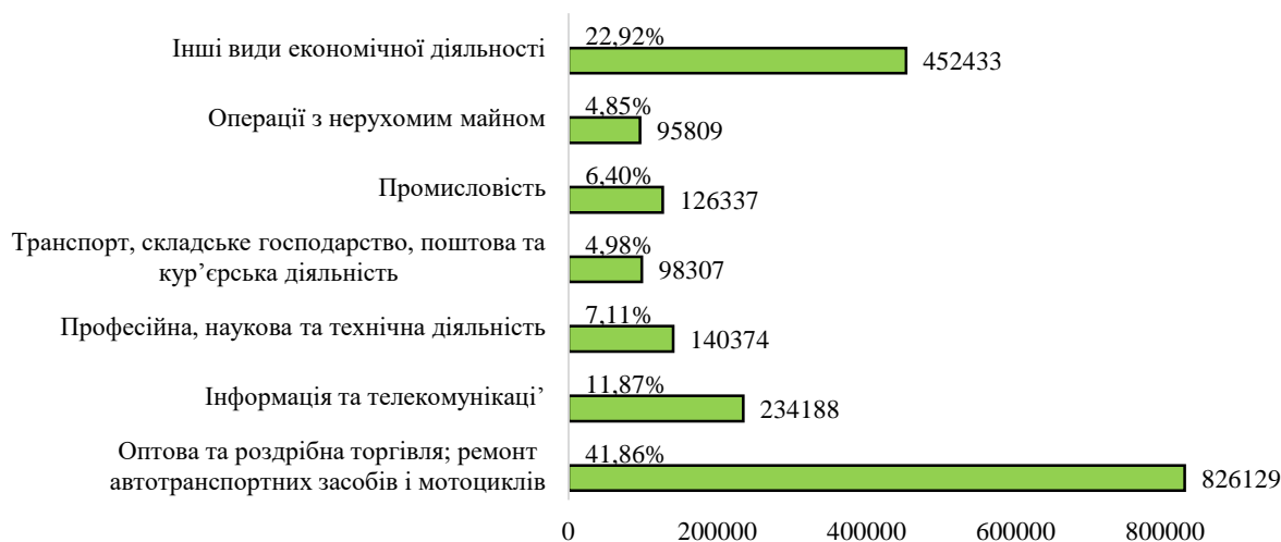
Рисунок 1. Кількість діючих суб'єктів підприємництва в Україні у 2020 році за видами економічної діяльності, од.

загальної кількості суб'єктів підприємницької діяльності (234188 од.), у професійній, науковій та технічній діяльності більш, ніж 7% (140374 од.). Сфера промисловості нараховує 6,40% усіх суб'єктів підприємницької діяльності, (126337 од.) у транспорті, складському господарстві, поштової та кур'єрській діяльності – 4,98% (98307 од.), в операціях з нерухомим майном задіяно 4,85% від загальної кількості підприємницьких структур (95809 од.) [9].