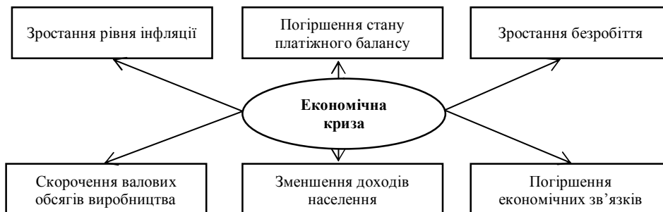
Рисунок 1. Чинники економічної кризи в Україні

Проаналізуємо індикатори економічної кризи в країні зобразивши їх схематично (рис. 1).