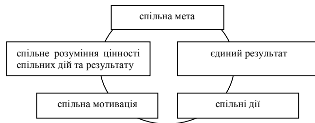
Рисунок 2. Елементи економічної взаємодії як системи

Для формування спільної діяльності найважливішою є спільна мета, яка визнана та обґрунтована для всіх учасників. Учасниками повинна бути розроблена підсистема стимулів та мотиваторів, яка визнається чутливою до всіх учасників, налагоджений механізм спільних дій, узгоджений за важливим критеріями. Загальний результат економічної взаємодії повинен бути єдиним для всіх учасників. Базою для налагодження взаємодії є сформоване єдине погоджене розуміння цінності формування системи. Цей елемент вважається найскладнішим у зв'язку із різними нормами та стандартами мислення та поведінки суб'єктів.